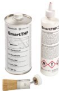
WELD, Flasche + Pinsel